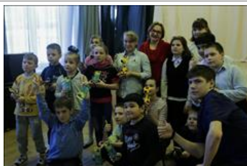
Презентация в Юкковской школе-интернате. Фото3. Самые активные участники получили в подарок жирафов.

Мероприятие: Презентация проекта Кинословарь «Вижу смысл» в школе-интернат № 1 (I вида для глухих детей)