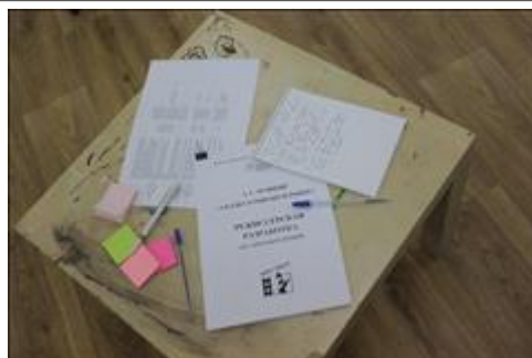
Читка и обсуждение сценариев. Фото 1. Сценарии 50 кинослов к "Сказке о рыбаке и рыбке" А.С. Пушкина.