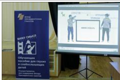
Презентация в Юкковской школе-интернате. Фото1. Кинословарь на экране для учеников и педагогов Юкковской школы-интерната.