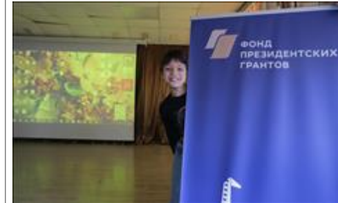
Презентация в школе-интернате № 20. Фото 4. После презентации настроение у всех просто отличное!

Остальные фото с презентаций Кинословаря "Вижу смысл": https://vk.com/album-69842220_253642120 - презентация в школе-интернате № 20 https://vk.com/album-69842220_253524358 - презентация в Южковской школе-интернате https://vk.com/album-69842220_253193388 - презентация в школе-интернате № 1 https://www.youtube.com/watch?v=21X11HWnkR0 - Репортаж о проведении презентаций