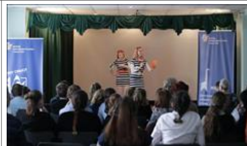
Презентация в школе-интернате № 1. Фото 2. Актёры театра игровой пластики МИ МИнор показывают прототип будущих кинослов.