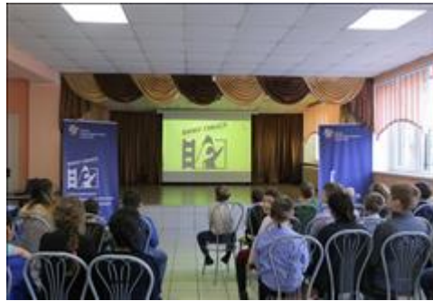
Презентация в школе-интернате № 20. Фото 1. Ученики школы-интерната № 20 смотрят кинослово "Как в воду опущенный".