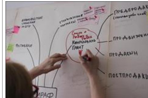
Совещание рабочей группы проекта. Фото 4.

Мероприятие: Читка и обсуждение сценариев