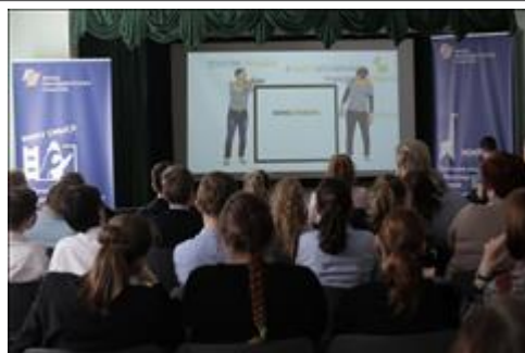
Презентация в школе-интернате № 1. Фото 1. Ученики школы-интерната № 1 смотрят Кинословарь.