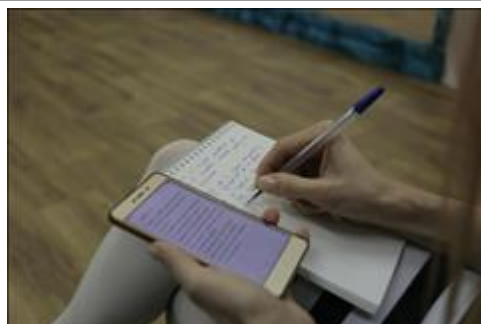
Читка и обсуждение сценариев. Фото 3. Распределение ролей и составление графика репетиционного процесса.

Мероприятие: Презентация проекта Кинословарь «Вижу смысл» в Юкковской школе-интернате