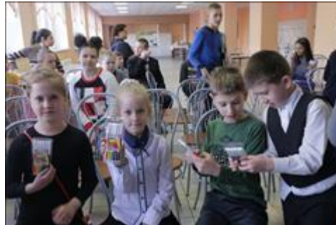
Презентация в школе-интернате № 20. Фото 3. Все участники презентации получили сувениры от киностудии "Жираф".